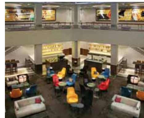
Lounge Bar Le Faubourg

Restaurant Le Faubourg has the flair of culinary hot spots in Paris. Indulge yourself and enjoy a taste of French savoir-vivre. The Lounge Bar Le Faubourg is an inviting ambience in which to relax. During the day you can work, read, talk or pass the time there in comfort, while in the evening it is the place to see and be seen, often to the sound of DJs or live music.