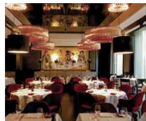
Restaurant Le Faubourg

Das Restaurant Le Faubourg erinnert an die kulinarischen Hot Spots in Paris. Lassen Sie sich verwöhnen und kosten Sie französische Lebensart. Die Lounge Bar Le Faubourg lädt zum Entspannen ein. Tagsüber kann man hier arbeiten, lesen, reden, sich verabreden und dabei wohlfühlen. Am Abend werden Sie sehen und gesehen – oft zu den Klängen von DJs oder Live-Musikern.